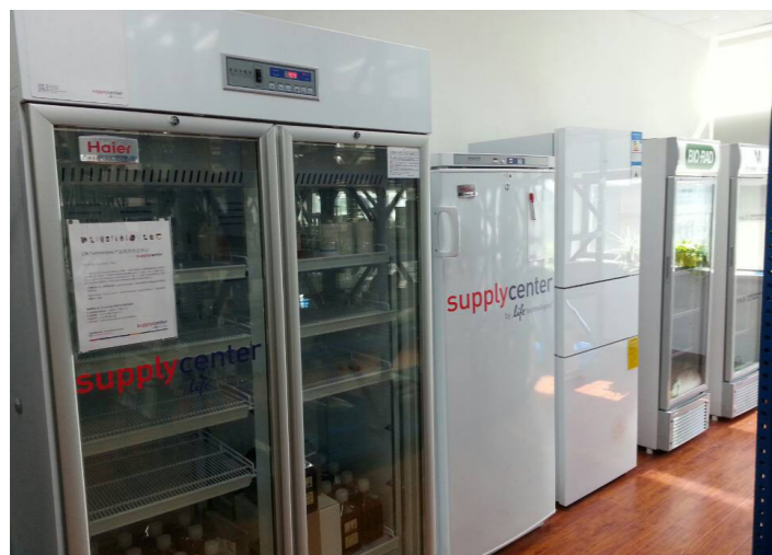
低温冷藏试剂现货库