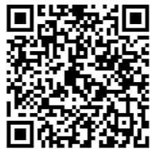
扫描二维码加入上海科技大学实验室安全管理微信讨论群

诚然，实验室安全管理是一个复杂的系统，仅仅做好以上工作还不足以构建一个完善的管理体系，甚至是远远不够的。其它一些工作，如实验室安全管理培训、安全应急管理、安全演习等也非常重要。我们并不因为这些内容不是当前工作的重心就置之不理或顺延开展。实验室安全管理工作显著区别于其它管理工作的一点就是安全系统的建立并不能单纯以孰重孰轻简单排序。任何一个环节的疏忽都有可能引起巨大的安全风险。因此在明确工作重心的同时必须兼顾各项工作的推进方可做到有备而无患。事实上，设备与资产处一直都在开展这些工作，只是我们要走的路还很长，更需要全校广大师生为我们提供宝贵的建议！