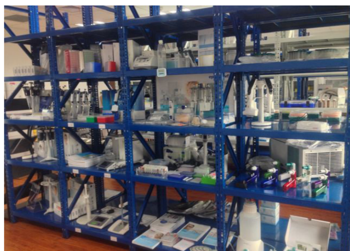
常温现货仓库一角