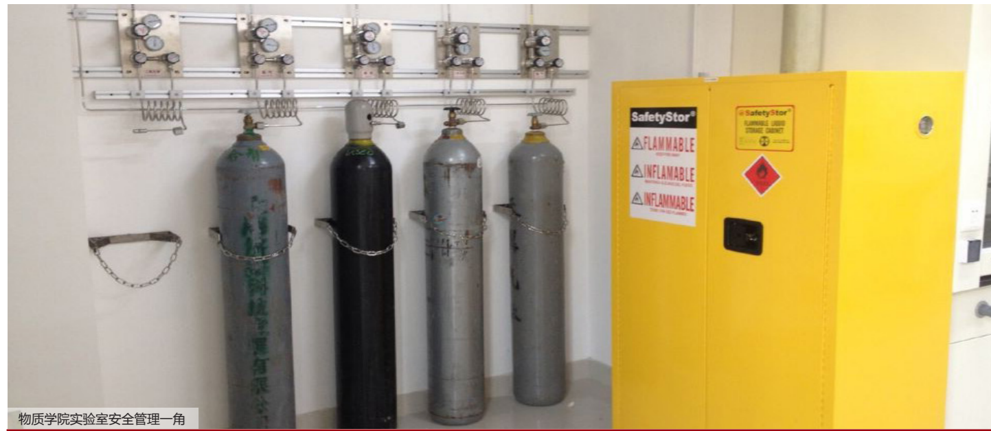
物质学院实验室安全管理一角